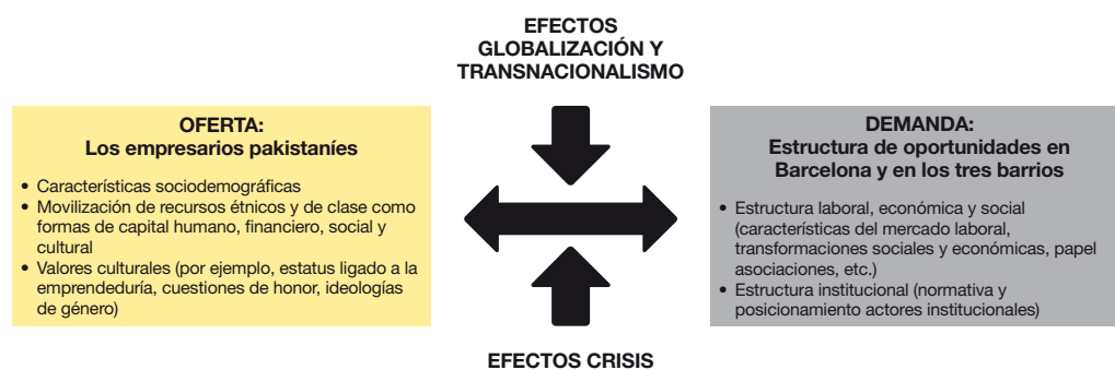
FIGURA 1. Aplicación del mixed embeddedness al marco analítico

Tal y como muestra la figura 1, el marco analítico de este artículo se sitúa, pues, dentro de la perspectiva teórica del mixed embeddedness . En este caso, la oferta se constituye por las características de los empresarios pakistaníes (sociodemográficas, acceso a capitales y valores culturales), mientras que la demanda incluye la estructura de oportunidades de la ciudad de Barcelona y los tres barrios seleccionados. Esta interacción, sin embargo, no debe interpretarse de manera estática, sino que está sujeta a los efectos de la crisis en el contexto español y catalán, así como a los de la globalización y el transnacionalismo.