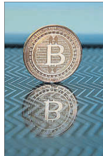
El bitcoin, por las nubes

► El real decreto aprobado ayer por el Gobierno sobre la Inspección Técnica de Vehículos (ITV), que flexibiliza algunos aspectos en aplicación de la normativa europea, también exige más medios para controlar fraudes en las emisiones de gases. Tras el dieselgate , se obliga, por primera vez, a las estaciones a disponer de herramientas de diagnóstico electrónico que se conecten con los ordenadores de a bordo de los vehículos. / Efe