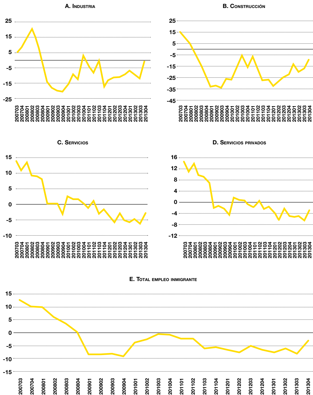
FIGURA 1. El empleo inmigrante según sectores (2007/T3-2013/T4) (Tasas de crecimiento anual de la ocupación inmigrante %)