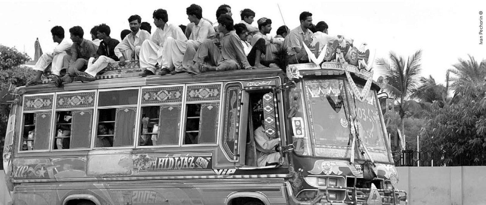
Ivan Pechorin ©

De marcat perfil ètnic i amb un component d'accés als recursos energètics, el conflicte de Balutxistan incorpora també les dues variables que hem exposat. Potser per això ha estat un dels que més atenció ha rebut de les autoritats d'Islamabad, que han iniciat processos de diàleg amb els balutxis. Tot i que representen un percentatge molt reduït de la població pakistanesa, també es troben presents a l'Iran i a l'Afganistan i, per tant, una complicació del conflicte podria tenir implicacions regionals.