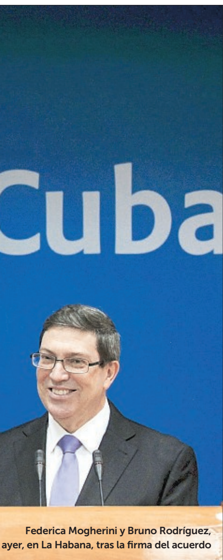
Federica Mogherini y Bruno Rodríguez, ayer, en La Habana, tras la firma del acuerdo

—Ha habido algunas señales. Digamos que no es que se ha-