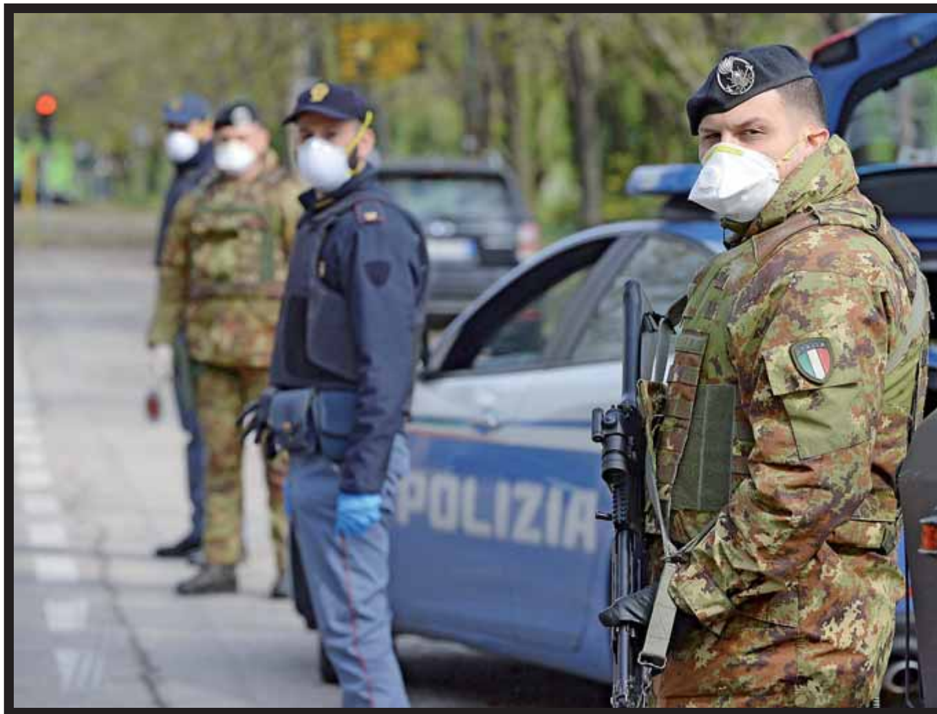
Una imatge de microscopi del coronavirus. Al costat, soldats italians en un control a prop de la ciutat de Milà. A sota, una imatge de Wall Street