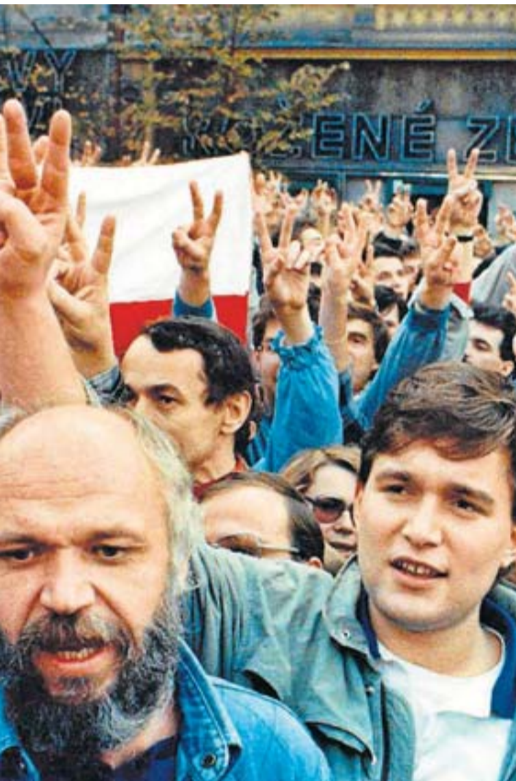
Protesta pacífica al centre de Praga el 28 d'octubre del 1989. La Revolució de Vellut va posar punt final a l'era soviètica al que ara són la República Txeca i Eslovàquia.