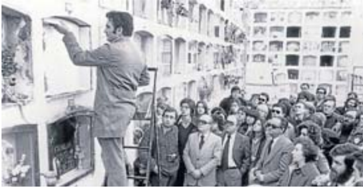
CREACIÓ DEL MIL Neix el Moviment Ibèric d'Alliberament (MIL), que defensa la lluita armada com a eina d'alliberament contra el capitalisme. Puig Antich n'era un dels membres. A la foto, homenatge del 1978 a Puig Antich.