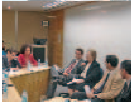
El fracàs de la política brasilera per a la integració d'Amèrica del Sud