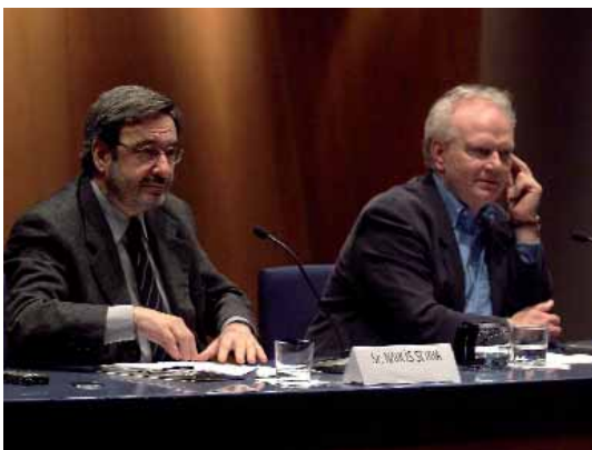
Conferencia "Viviendo en una sociedad de riesgo mundial" Narcís Serra y Ulrich Beck