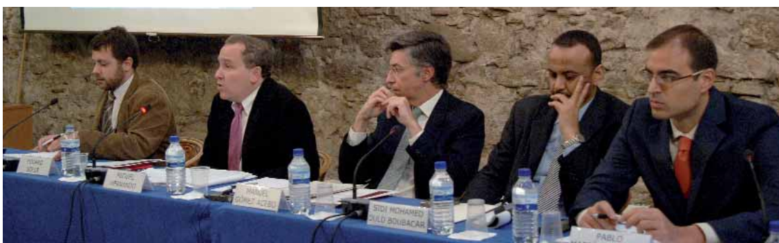
Mauritania: dinámicas interculturales, procesos políticos y relaciones con España

12, 13 y 14 de noviembre. Fundación CIDOB