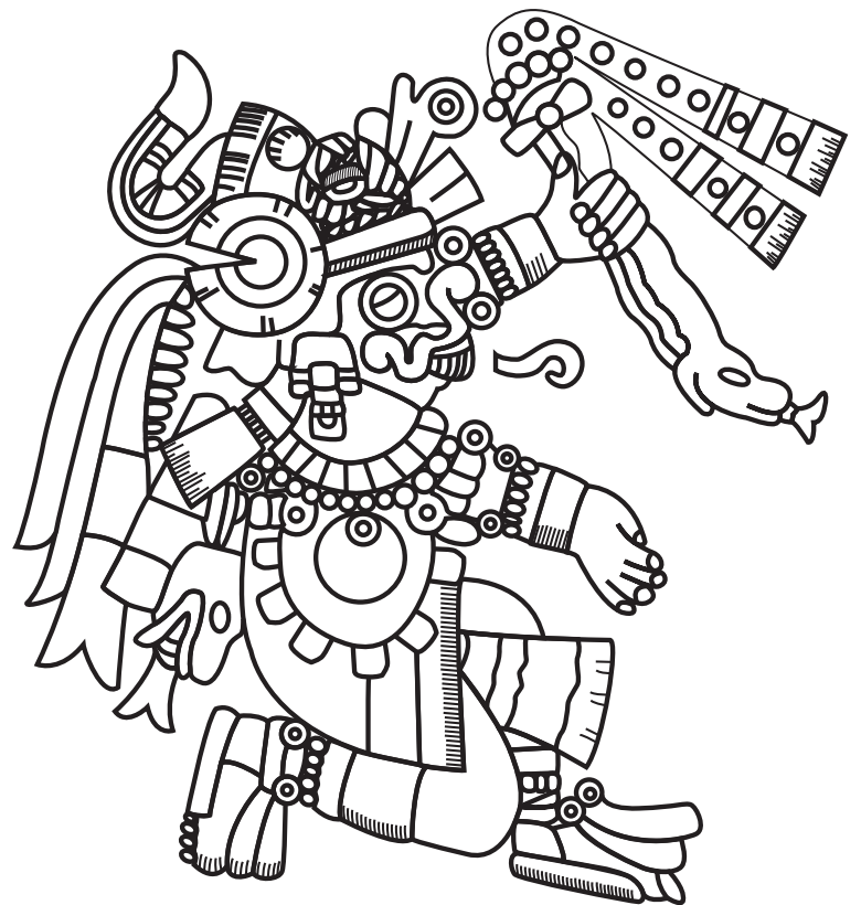
Litografia de Tlaloc, déu de l'aigua i la fertilitat a la mitologia asteca

La quantitat d'aigua en el planeta és constant però molts recursos hídrics estan contaminats; per tant, la situació és encara més crítica, ja que l'oferta del recurs hídric no és constant i està disminuint