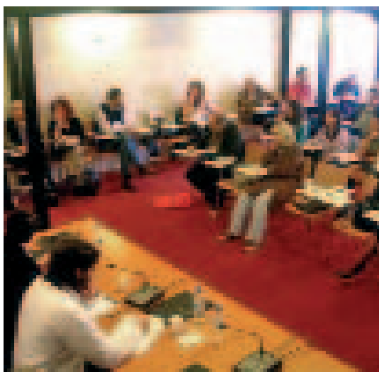
Intercultural Citizenship: Political Participations and Muslims

24-26 de noviembre. Departamento de Sociología de la Istanbul Bilgi University, Estambul