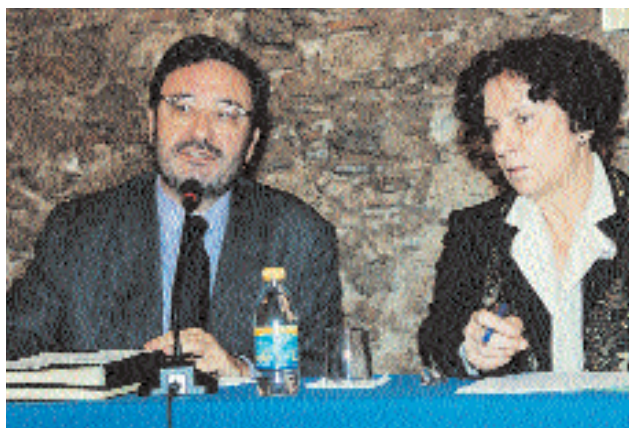
Anuario internacional CIDOB 2001 › Narcís Serra y Ana Palacio

Al acto asistieron relevantes personalidades del mundo político y académico así como expertos en temas asiáticos. Fundació CIDOB , 4 de noviembre.