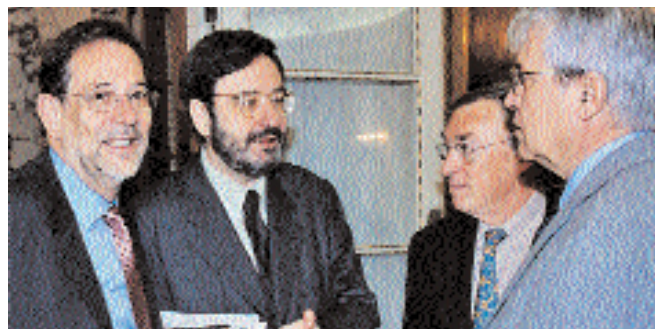
Guerra y Paz: una perspectiva europea > Javier Solana, Narcís Serra, Jordi Solé Tura y Joan Clos

La conferencia se sitúa en el marco del proyecto conjunto de la Fundación Bertelsmann y el Banco Mundial intitulado "Hacia la integración europea", iniciado en 1999. Se trata de una reunión a alto nivel con unos cincuenta expertos académicos y responsables políticos y económicos de los países candidatos de la Europa Central y Oriental, de la UE y de países miembros, con el objetivo de acercar a los países candidatos la experiencia en varios ámbitos de los países miembros así como promover contactos directos en los diversos actores. Además de los participantes extranjeros, la Fundació CIDOB seleccionó a participantes catalanes para intervenir en la conferencia.